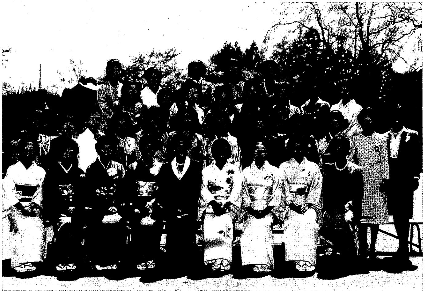
4月19日 認証6周年記念