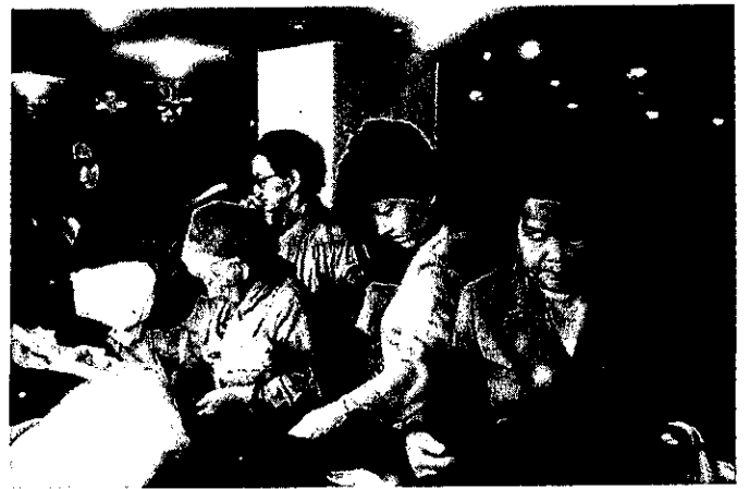
10.12 第9回チャリティバザー (岡島デパート)