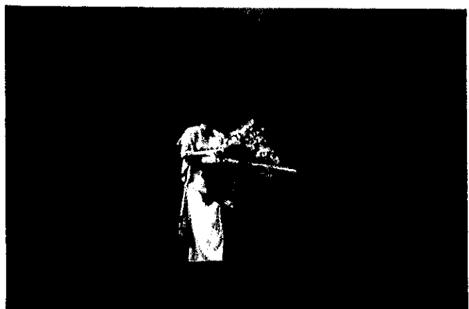
辻 久子ヴァイオリンコンサート