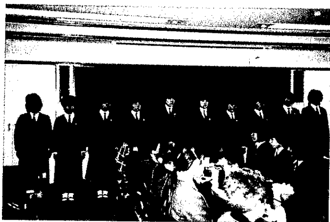
'85. 2. 16 Sクラブ卒業生を送る会