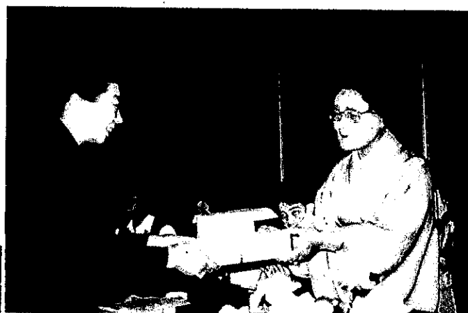
4. 15 クラブ表彰