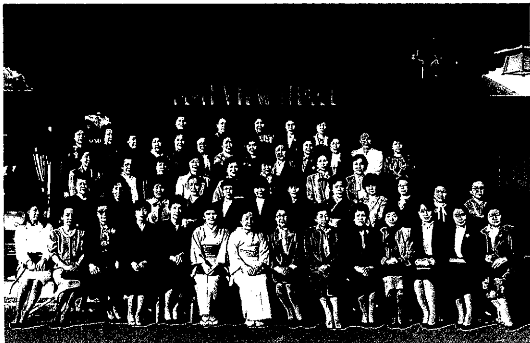
国際ソロプチミスト山梨一芙蓉結成式 於 富士ビューホテル '84.11.26