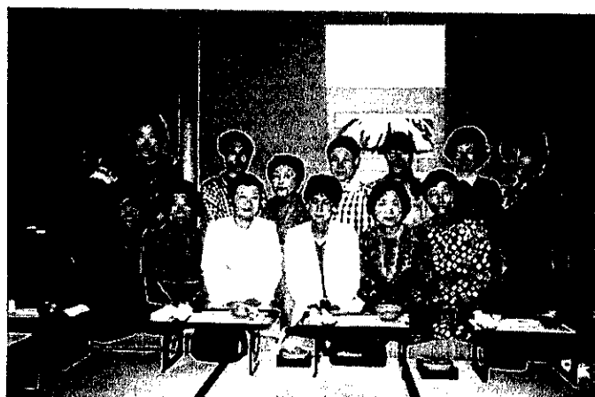
9. 22 第2回ユニセフコンサート (県民文化ホール)