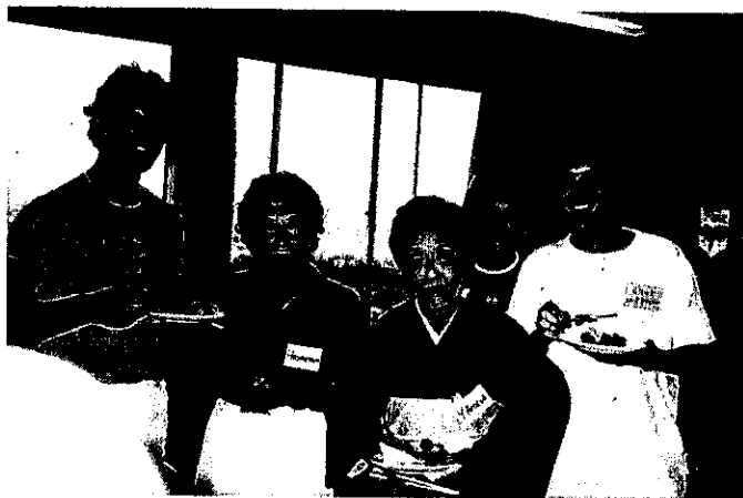
'84. 8. 26 火祭りー第9回留学生招待

このような大会に出席する事によって私共は、決して小さな日本の一地域で活動しているのではない。世界のソロプチミストと同じ意義と目的を持って、手を繋いでいるのだという事を眼で見、肌で感じる事が出来ます。言葉や習慣、肌の色の違いは問題ではありません。私共は全部同じ女性として世界中の人々の繁栄・平等のために日夜努力しているのです。どのクラブからももっと大勢の方々が出席なさって、広い大きな眼でソロプチミストを見詰められる事を願って居ります。