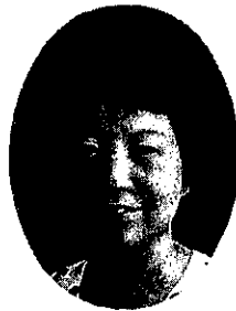
関東地区セクレタリー

加任務として課せられた分割推進に就きましても、各クラブの御理解を得て、夫々に回答を頂き、大きな峠を越す事が出来たと存じております。之も偏に地区の皆様始め、S I山梨の温い御協力のお蔭であり、正に真摯なる友情の賜と感謝致します。認証以来クラブ役職を全て経験し、私なりにソロプチミズムを体得してきた心算でしたが、所詮は「井の中の蛙」であったと勉強不足を痛感致しました。リジョン理事会への出席、クラブ公式訪問その他、初めての体験の中で、素晴らしい方々との出会いに恵まれ、実に多くの事を学ぶ機会を与えられている幸せを感謝し、今後の地区諸行事が滞りなく果せまます様祈りつつ、任期後半精一杯努めて参り度いと希っております。