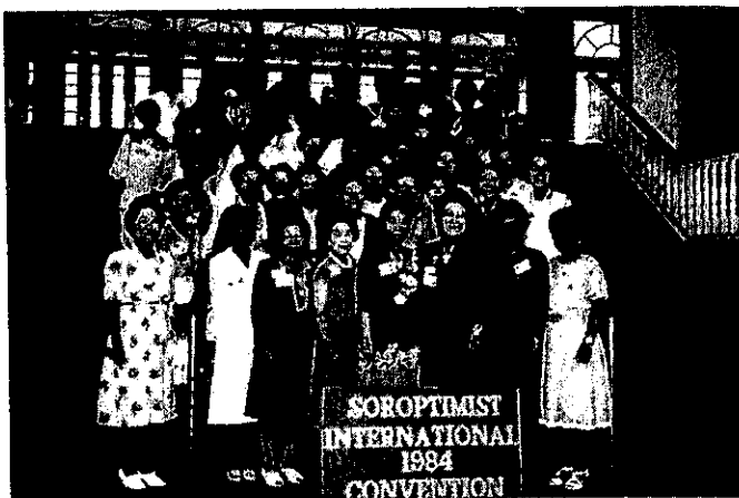
第28回アメリカ連盟大会