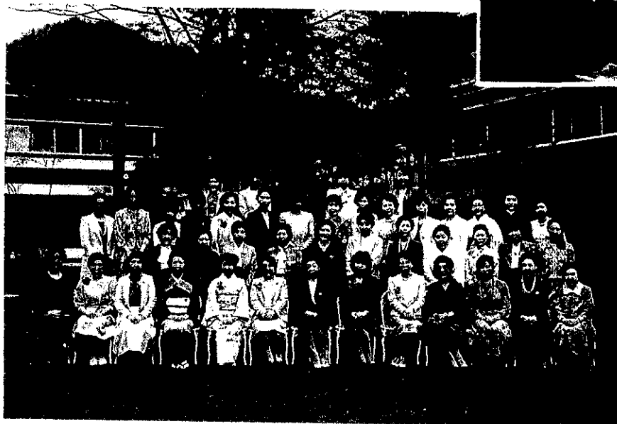
4. 15 新会員入会式 (常磐ホテル)