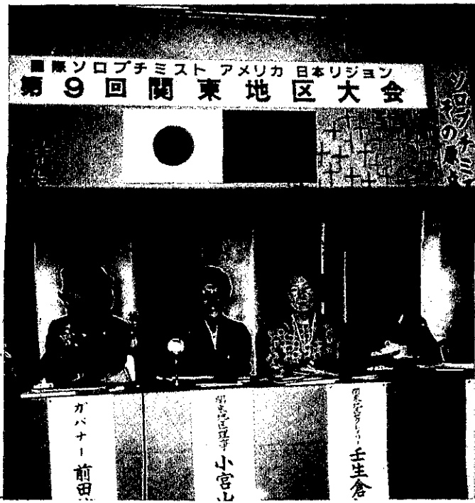
9.27 第9回関東地区大会 (箱根プリンスホテル)