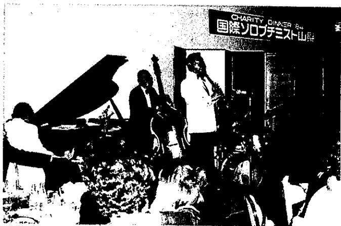
12.1 第9回チャリティーディナー (古名屋ホテル)