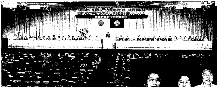
'95.6.15 第9回日本東リジョン大会