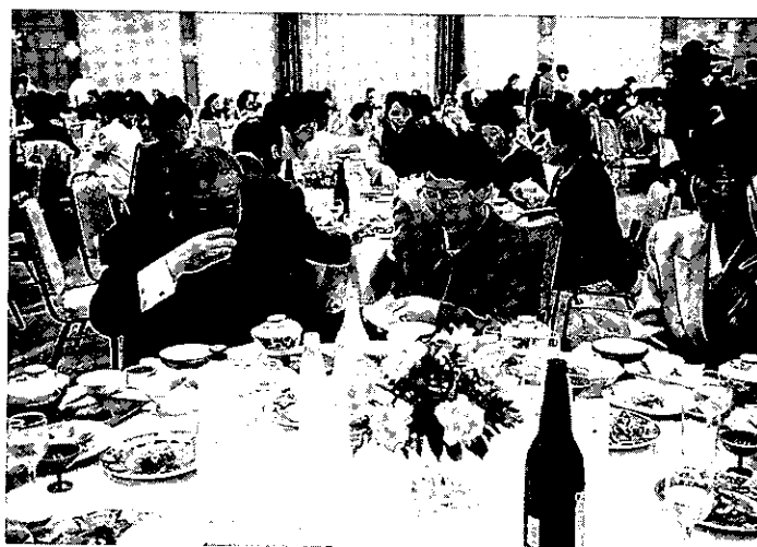
'94.12.2 チャリティーディナー'94会場風景