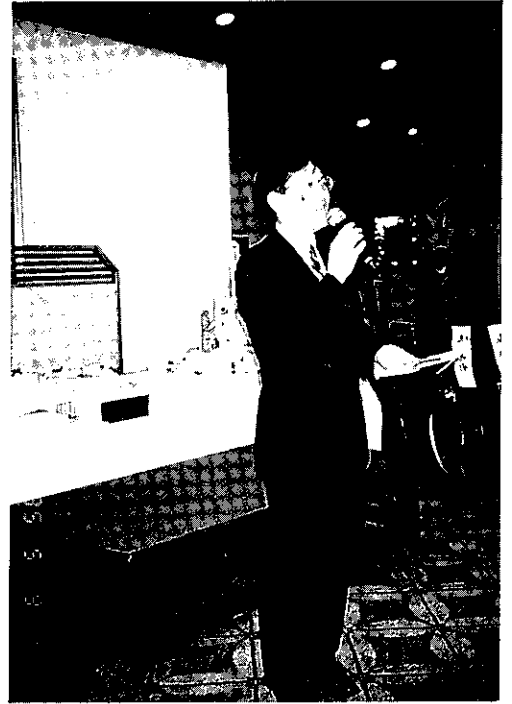
「あしなが育英会」代表 御礼挨拶