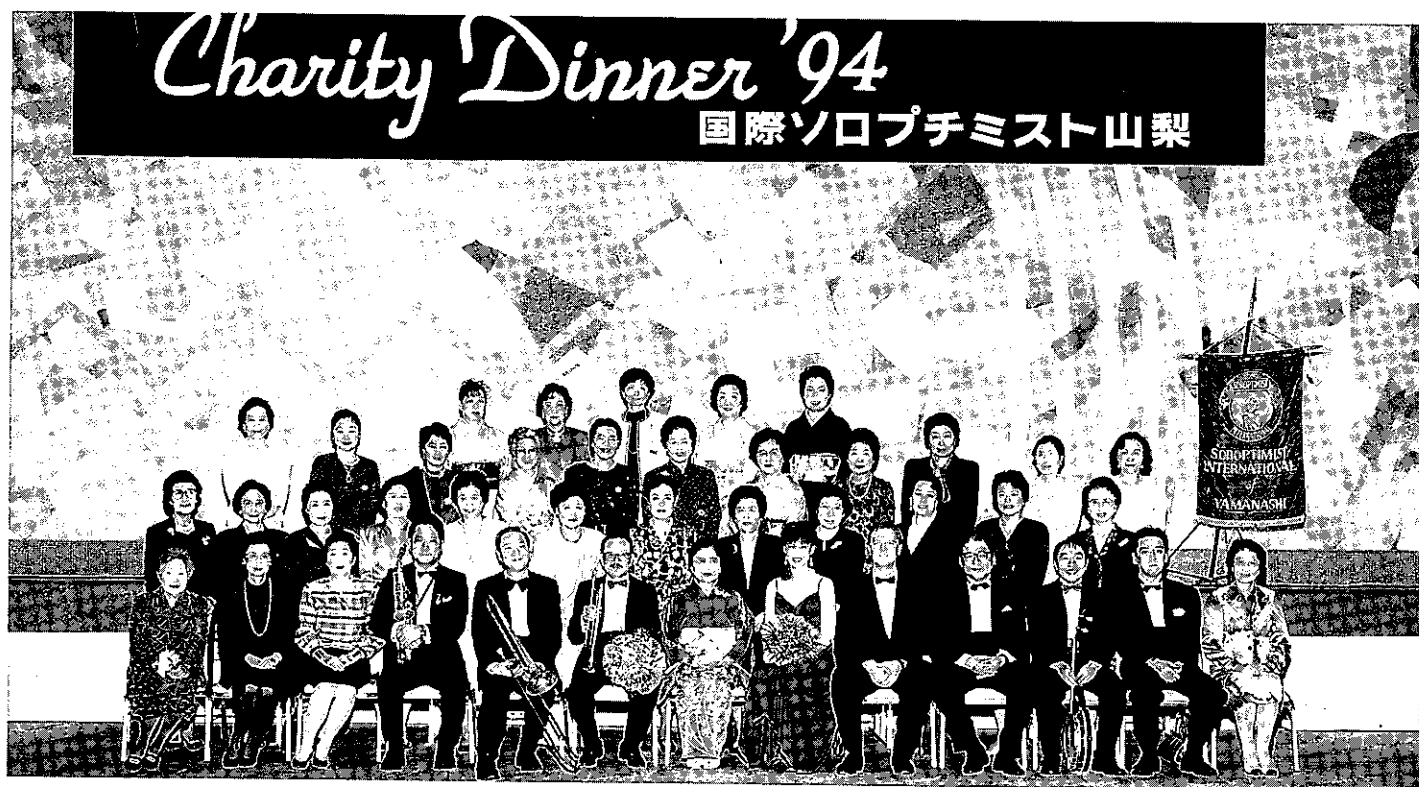
'94.12.2 チャリティーディナー'94