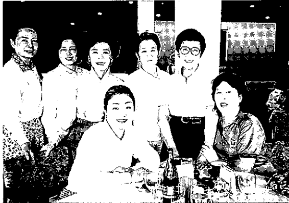
参加姉妹クラブの皆様