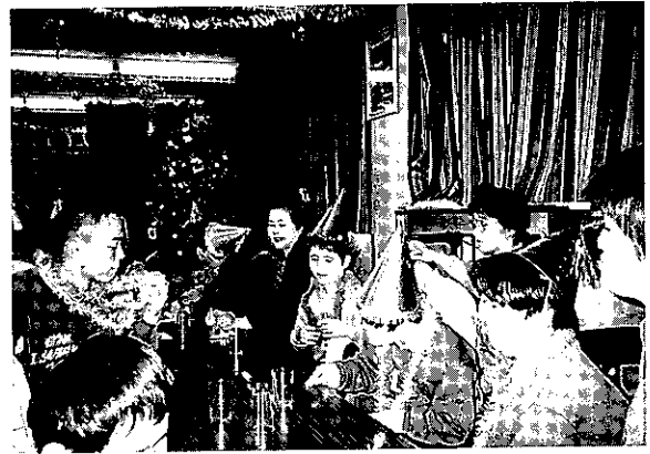
'94.12.24 ライトハウスクリスマス会