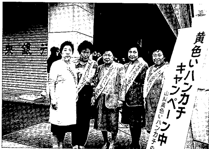
'94.10.20 黄色いハンカチバザーお手伝