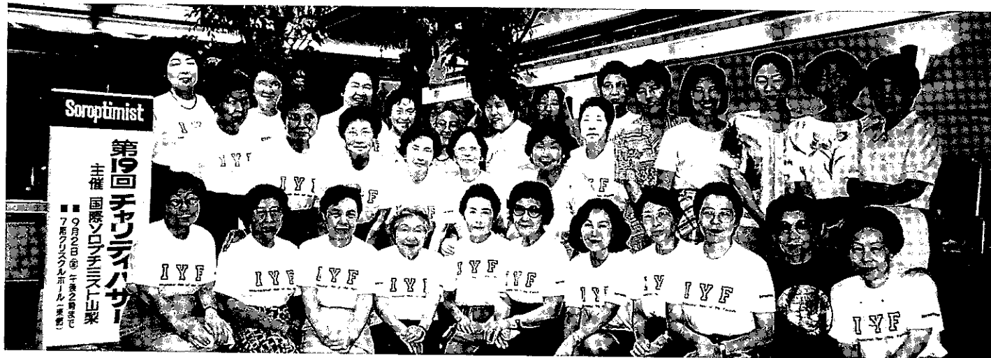
'94.9.2 バザーを終えて全員集合