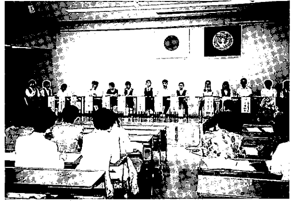
'95.6.11 ユースフォーラム山梨予選