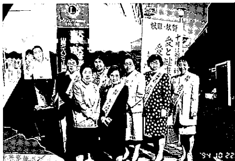
'94.10.22 献眼、献腎街頭キャンペーン