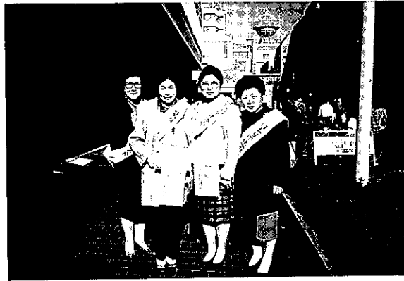
'94.12.18 ハンドインハンド街頭募金