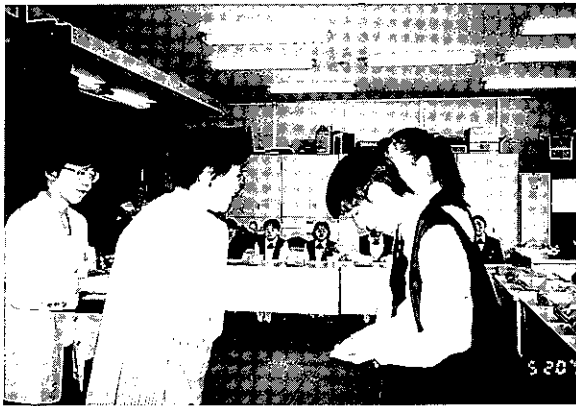
'95.5.20 Sクラブ新会員入会式