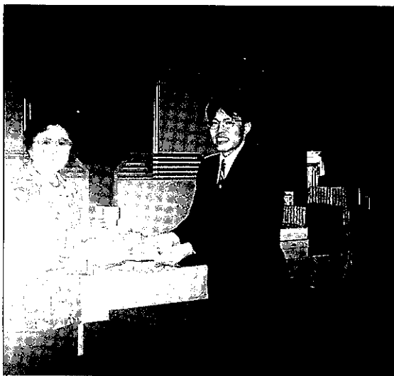
'95. 5. 9 チャリティーゴルフ大会