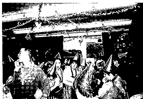
'94.12.24 ライトハウス、クリスマス会出席

ソプロチミストとしての、プログラム委員会としての原点に、もう一度戻って考えるよい機会を得られたと実感した一日だった。