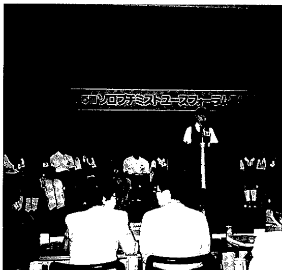
'95.7.24 ユース・フォーラム

学業、生徒会活動と忙しい中、生徒さん達の当然の様にボランティア活動をしよう、という心意気が伝わってきた1日でした。