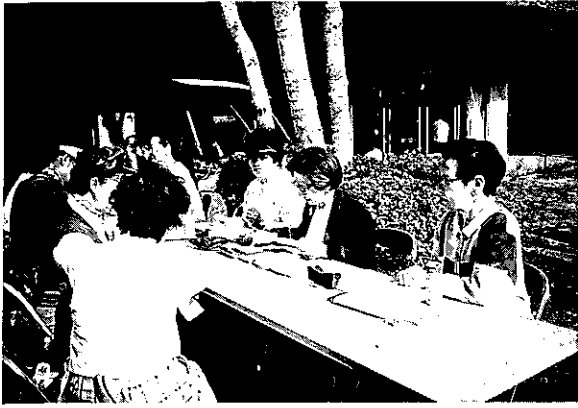
'95.5.9 第2回チャリティーゴルフ大会(富士桜C.C.)